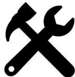
b) Werkzeug und Geräte